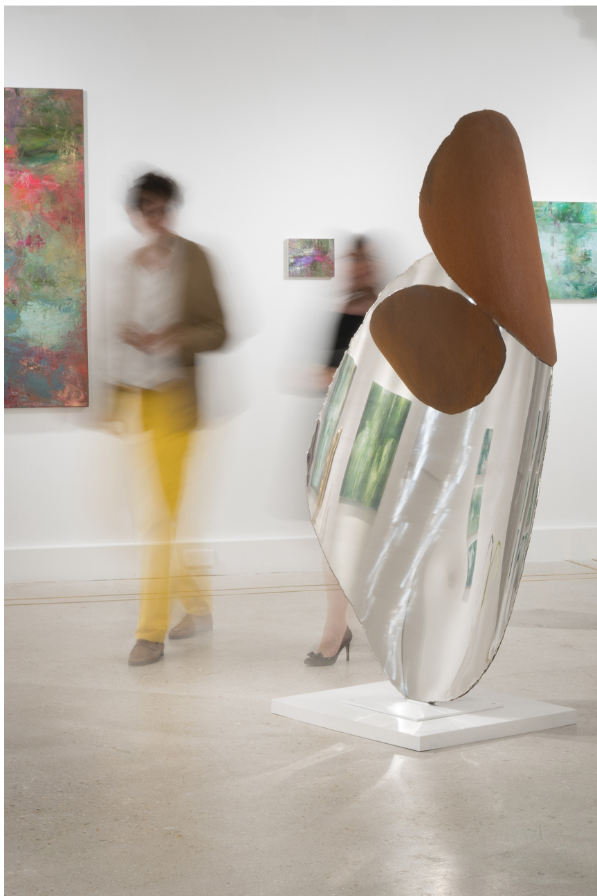
Samare 2018, acier Corten et inox poli miroir, 203 x 107 x 68 cm © Galerie Ariane C-Y, Web Style Story