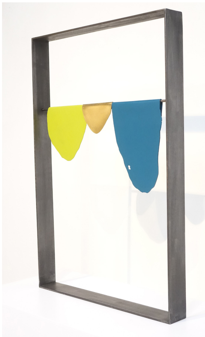
Fil , 2019, acier laqué et laiton, 50 x 25 x 4 cm