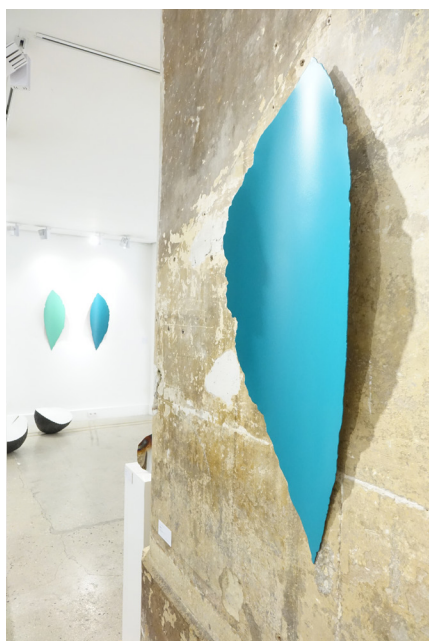
Bribes 2019, acier Corten et laque, 94 x 32 x 7 cm